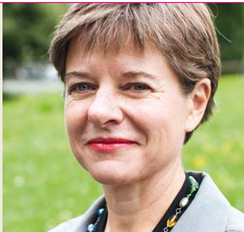
Stadträtin Claudia Nielsen Vorsteherin des Gesundheits- und Umweltdepartements der Stadt Zürich

3. Auflage, Oktober 2011 8000 Exemplare Gedruckt auf «RecyStar», 100 % Recyclingpapier